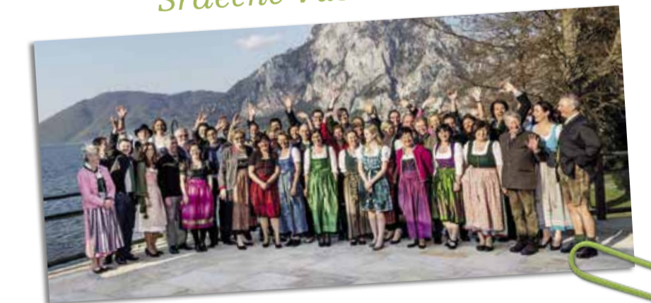
Síť hotelů LANDHOTELS